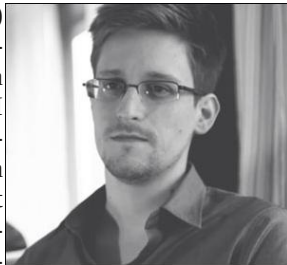
Hős vagy áruló?

Még Snowden leplezte le az USA-kormány legnagyobb hírszerzési műveletét, a PRISM nevű programot, ami keretében az NSA (USA Nemzetvédelmi Hivatal) minden a nagy cégeknél tárolt információhoz (e-mailek, iratok, fényképek, személyes adatok) hozzáfér. A programot a 2007-ben kiadott Protect America törvény indította el. A PRISM felügyeletét a Külföldi Hírszerzési Törvény alapján a Foreign Intelligence Surveillance Court látja el. A Microsoft már 2007-ben csatlakozott, a többiek után. Az Igazságügyi Minisztérium 2008-ban engedélyt kapott a Kongresszustól, hogy a „vonakodó” cégeket is kötelezze a PRISM elvárásainak betartására, ha kell bírósági ítélet formájában is.