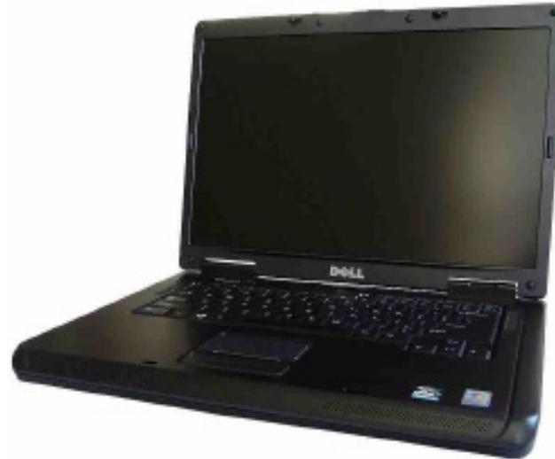
Dell Vostro 1000

A „háttérembere” egyetlen személy volt: én. Szereti a PCLinuxOS-t és tudja, én is nagyon messze vagyok a Windows világtól, hogy képes legyek segítséget nyújtani „ahhoz” az átkozott, kereskedelmi forgalomban elérhető operációs rendszerhez. Ezért, ha technikai támogatásra van szüksége, tudja, hogy a PCLinuxOS a legjobb választás. Szereti, hogy (akár a sör) minden ingyen van, és a biztonságot, amit a Linux a legtöbb vírus és rosszindulatú programmal szemben nyújt.