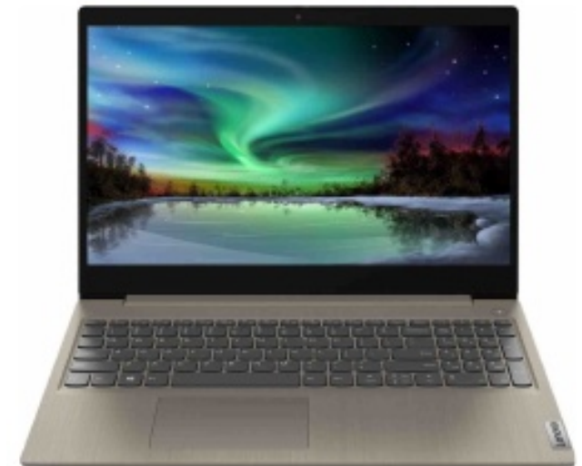
Lenovo Ideapad 3, 8GB RAM, 256GB SSD, 15.6" screen

Az egyszerűség kedvéért Xfce asztalt futtat, akár én. Ezáltal bármikor, ha be kell lépnem a számítógépébe, hogy „komolyabb” dolgokat csináljak, a felület ismerős számomra, mintha otthon a saját gépemen lennék.